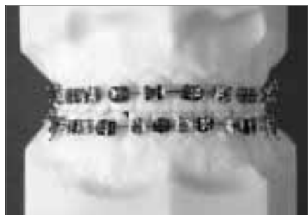
Abb. 1: Multiband-Bracket-Apparatur mit Stahlbrackets. Der Drahtbogen ist am Bracket durch Gummiligaturen befestigt.

Die Multiband-Bracket-Apparatur setzt sich aus drei wesentlichen konfektionierten Elementen zusammen: Brackets, Bänder, Drahtbögen. Brackets (siehe Abb. 1-3) bestehen oft aus Edelstahl, können jedoch auch aus Keramik, Kunststoff oder Titan hergestellt werden. Die Auswahl hängt dabei im Wesentlichen vom Ästhetikempfinden des Patienten ab. Bei Erwachsenen kommt aus diesem Grund zuweilen auch eine auf der Innenseite der Zähne befestigte Bracketapparatur zum Einsatz (Abb. 3).