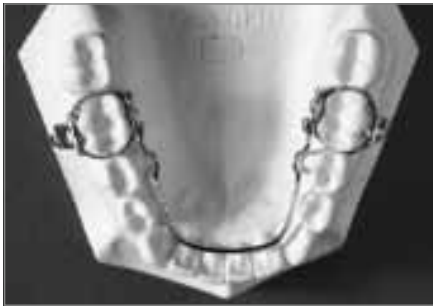
Abb. 8: Lingualbogen

hier ist zwischen einer fest an den Molarenbändern befestigten Variante und einer bei Kontrollterminen herausnehmbaren und adjustierbaren Variante (wie in Abbildung 8 dargestellt) zu unterscheiden.