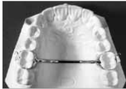
Abb. 4: Transpalatinalbogen, Bügel fest mit den Molarenbändern verschweißt

Brackets werden mit Hilfe von Adhäsivklebern am Zahnschmelz befestigt. Im Bereich der Molaren kommen vielfach Bänder zur Anwendung, welche aus Edelstahl hergestellt werden und durch Zemente befestigt werden. Bänder halten Kaukräften im Bereich der Molaren oft besser stand als Brackets und erlauben außerdem die Befestigung von weiteren Hilfselementen, wie zum Beispiel des unten genannten Palatinalbogens (siehe Abb. 4 oder 5). Drahtbögen verbinden die Brackets miteinander und werden im Bracketslot mit Hilfe von so genannten Ligaturendrähten