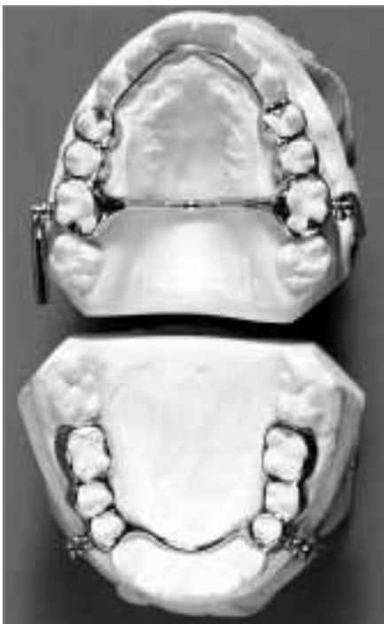
Abb. 11b: Herbstapparatur, Aufsicht auf Ober- und Unterkiefermodell

Durch Umbauvorgänge im Bereich des Kiefergelenks, Wachstumshemmung des Oberkiefers und durch Veränderungen der Position der Zähne in Ober- und Unterkiefer wird die Verzahnung korrigiert. Die zunehmende Beliebtheit dieser Apparatur ist neben der relativ schnellen Korrektur großer Diskrepanzen auch darauf zurückzuführen, dass das Gerät im Gegensatz zu herausnehmbaren kieferorthopädischen Apparaturen unabhängig vom Trageeifer des Patienten ist.