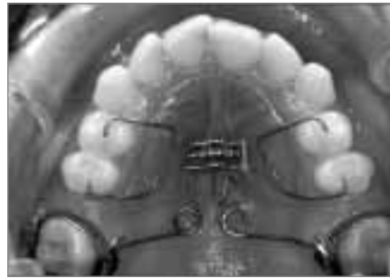
Abb. 12b: Pendulum-Apparatur nach der Molarendistalisierung