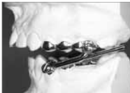
Abb. 11a: Herbstapparatur, Seitenansicht auf Gipsmodell