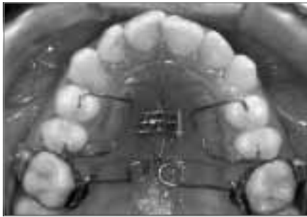
Abb. 12a: Pendulum-Apparatur nach dem Einsetzen