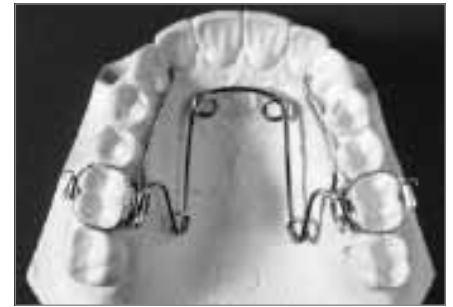
Abb. 10: Quadhelix

Die Quadhelix (Abb. 10) dient ebenfalls der Erweiterung des Oberkiefers und kann im Rahmen der kieferorthopädischen Frühbehandlung ähnliche orthopädische Effekte wie die Hyrax-Apparatur erzielen. Mit zunehmendem Alter des Patienten jedoch nimmt die Wirkung auf den Kiefer ab und die Quadhelix bewirkt nur noch die Bewegung von Zähnen.