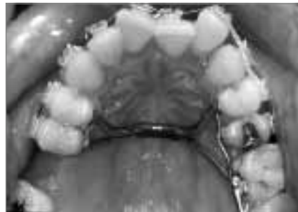
Abb. 6: Erweiterter Transpalatinalbogen zur Verankerung der Seitenzähne

von Bracket und Drahtbogen ermöglicht bei geeigneter Aktivierung vielfältige und sehr gezielte Bewegungsmöglichkeiten der Zähne. Besonderer Wert muss auf eine sorgfältige Mundhygiene des Patienten gelegt werden, da die Apparatur in den meisten Fällen über einen Zeitraum von circa zwei Jahren getragen wird.