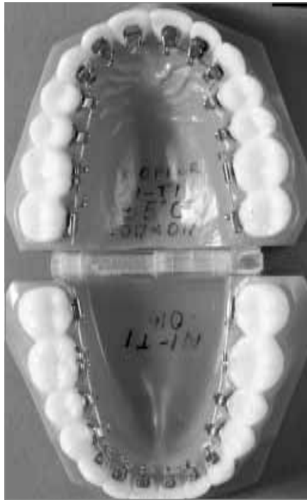
Abb. 3: Multiband-Bracket-Apparatur, von innen auf den Zähnen befestigt

Brackets werden mit Hilfe von Adhäsivklebern am Zahnschmelz befestigt. Im Bereich der Molaren kommen vielfach Bänder zur Anwendung, welche aus Edelstahl hergestellt werden und durch Zemente befestigt werden. Bänder halten Kaukräften im Bereich der Molaren oft besser stand als Brackets und erlauben außerdem die Befestigung von weiteren Hilfselementen, wie zum Beispiel des unten genannten Palatinalbogens (siehe Abb. 4 oder 5). Drahtbögen verbinden die Brackets miteinander und werden im Bracketslot mit Hilfe von so genannten Ligaturendrähten