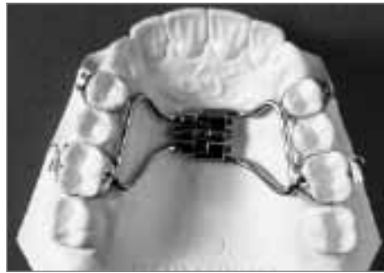
Abb. 9: Hyrax-Apparatur

Die Hyrax-Apparatur (Abb. 9) dient der forcierten Gaumennahterweiterung; innerhalb