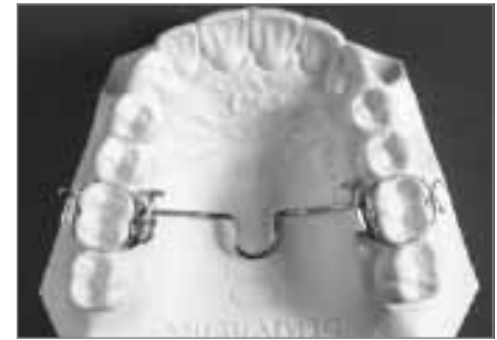
Abb. 5: Transpalatinalbogen nach Goshgarian

Verschiedene Varianten des Transpalatinalbogens kommen zum Einsatz: Abbildung