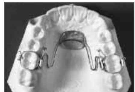
Abb. 7: Nance-Apparatur

eine Abstützung an der Gaumenschleimhaut über eine Kunststoffabdeckung auf. Dies ist von Vorteil, wenn Molaren an einer Vorwärtsbewegung gehindert werden sollen oder die Verankerung durch die Molaren gegen Zahnbewegung verstärkt werden muss.