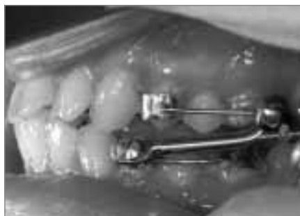
Abb. 11c: Herbstapparatur, Seitenansicht im Mund