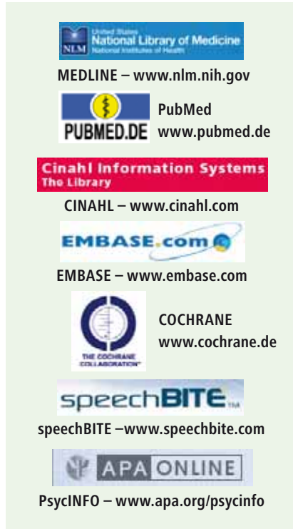
■ Abb. 2: Quellen für Studien