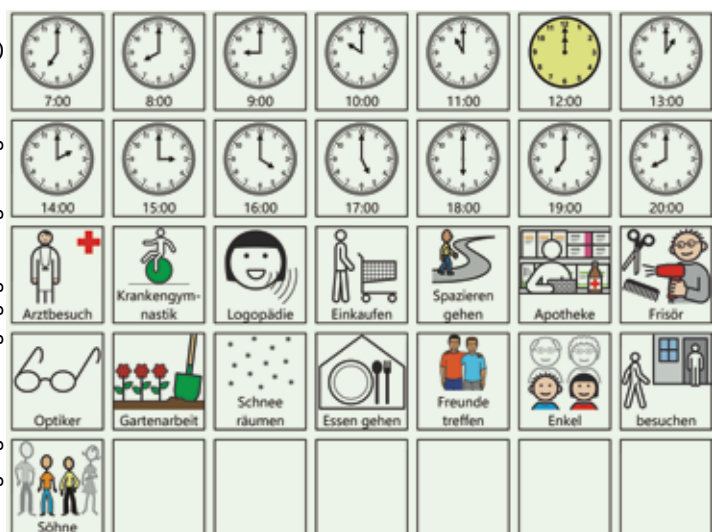
■ Abb. 5 Symbole für Tagesplan (Fallbeispiel 2)

Erzählmöglichkeit über aktuelle Themen wurde die Seite „Aktuelles“ erstellt.