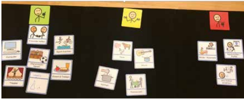
■ Abb. 2: Aktivitäten auswählen

In der Praxis und Beratungsstelle „logBUK“ haben wir folgenden Ablauf etabliert: