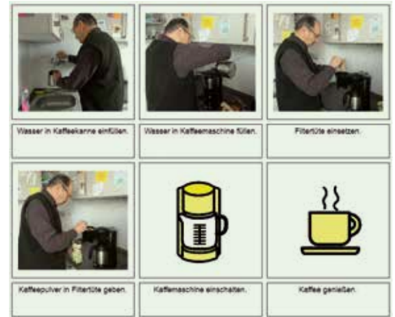
■ Abb. 4: Ablauf Kaffeekochen (Fallbeispiel 2)

In der Therapie wurde trainiert, wie der Patient für ihn alltagsrelevante Wörter in der Strategie findet. Zunächst allein und mit zunehmender Progression der Krankheit mithilfe seiner Partnerin. Zudem wurde zusammen mit dem Patienten ein Ich-Buch angelegt, mit dem er Informationen und Aussagen zu sich selbst geben konnte. Als Gedächtnisstütze sowie als