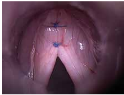
Abb. 2: Glottoplastik postOP