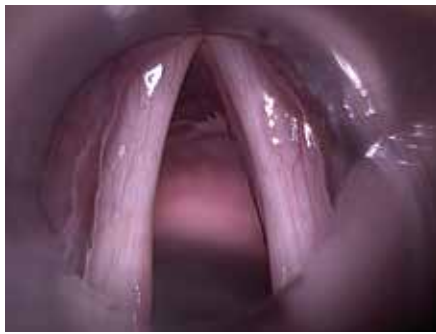
Abb. 1: Glottoplastik präOP