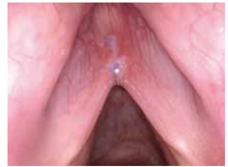
Abb. 3: Glottoplastik 6. Woche postOP

bestehenden Ergebnisse, dass durch alleinige Operation zwar eine höhere Stimmlage, jedoch kein vollständig weiblicher Stimmklang erreicht wurde. Deswegen muss die Phonochirurgie zukünftig stärker in ein umfassendes Behandlungskonzept aus logopädischem Stimmtraining, Übungen für eine weibliche Gestik und Mimik sowie Alltags-training eingebunden werden.“ Die Notwendigkeit der unterstützenden Stimmtherapie zum Gelingen des Stimmfeminisierungsprozesses wird in verschiedenen Studien betont (Kim 2017, Casado et al. 2017).